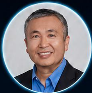
若田 光一 氏

半導体技術と宇宙産業の融合が、 新たな産業構造とビジネス機会を生み出しています。 本イベントでは、宇宙開発・半導体分野の第一線で活躍する 企業・研究者を迎え、最前線の取り組みと 共創による未来の可能性を探ります。