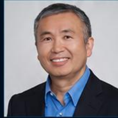
若田 光一 氏 米Axiom Space社 CTO 兼 宇宙飛行士